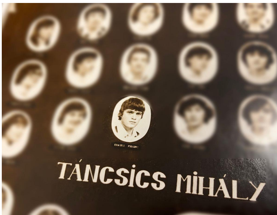
Krausz Ferenc fotója az érettségi tablón

Viccből persze, de feltettük a kérdést, hogy vajon melyik diák veheti majd át a következő Nobel-díjat , mire az igazgatónő megjegyezte, hogy szívesen bevállalnának egy ilyen kitüntetést kémiából is .