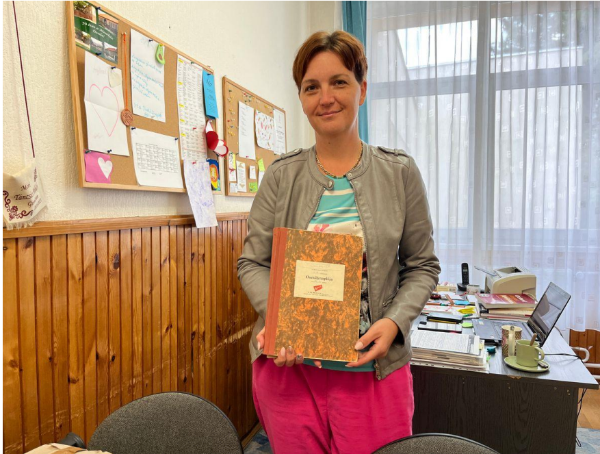
Az igazgatóelőlvette az osztálynaplót

Krausz már diákkorában kiemelt érdeklődést mutatott a reáltárgyak iránt. A fizikaszertárban jelenleg is azok az eszközök állnak a tanulók rendelkezésére, melyeken annak idején a tudós is részt vehetett a kísérletekben. A szertárban egyébként éppen óra zajlott.