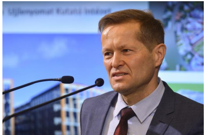
Krausz Ferenc Nobel-díjat kapott.

Benne volt a csibészségben a testvére szerint, a tanárai viszont