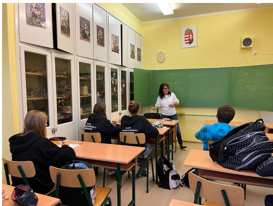
A fizikaszertárban óra zajlik

Viccből persze, de feltettük a kérdést, hogy vajon melyik diák veheti majd át a következő Nobel-díjat , mire az igazgatónő megjegyezte, hogy szívesen bevállalnának egy ilyen kitüntetést kémiából is .